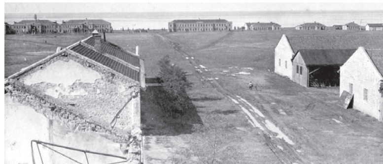
Качинская лётная школа. Фото 1923 г.